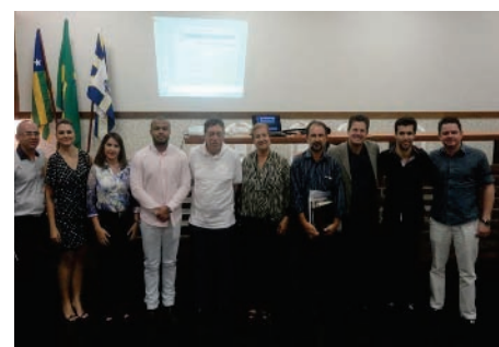
Posse: membros das comissões e conselheiros do Cremego

A obrigatoriedade de instalação de Comissões de Ética Médica nas unidades de saúde é definida pela Resolução número 1657/2002, do Conselho Federal de Medicina (CFM), que estabelece as normas de organização, funcionamento, eleição e competências destas comissões. Todos os estabelecimentos com mais de 15 médicos devem ter comissões de ética.