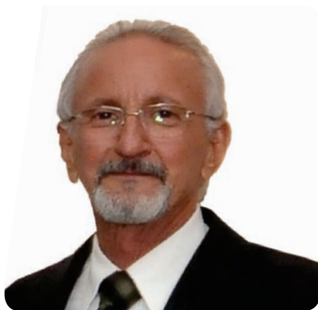
Erso Guimarães Presidente

Cabe também aos médicos denunciarem as falhas encontradas. Precisamos unir forças contra esse descaso com a saúde, contra a falta de compromisso com a classe médica e com a sociedade. Unidades de saúde sucateadas e postos de fachada não combinam com a medicina que queremos nem com o atendimento que os brasileiros necessitam.