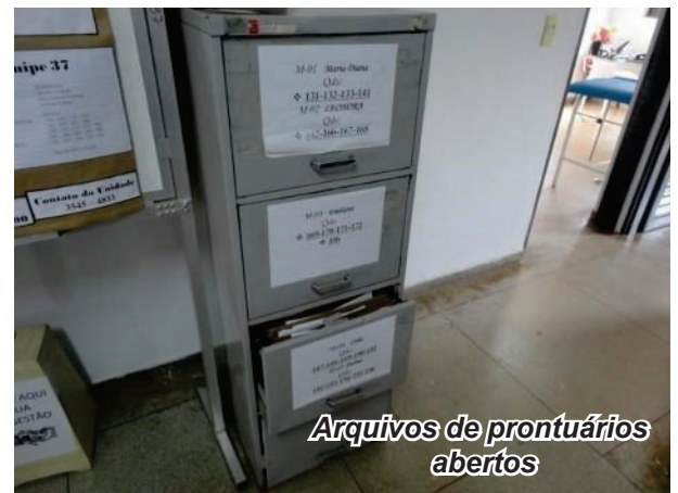
Arquivos de prontuários abertos

A fiscalização do Cremego encontrou irregularidades em todas as Unidades Básicas de Saúde (UBSs) e postos de Saúde da Família fiscalizados em Goiás, entre outubro e dezembro de 2014. Dados do Conselho Federal de Medicina revelam que as deficiências na assistência básica à saúde são registradas em todo o País.